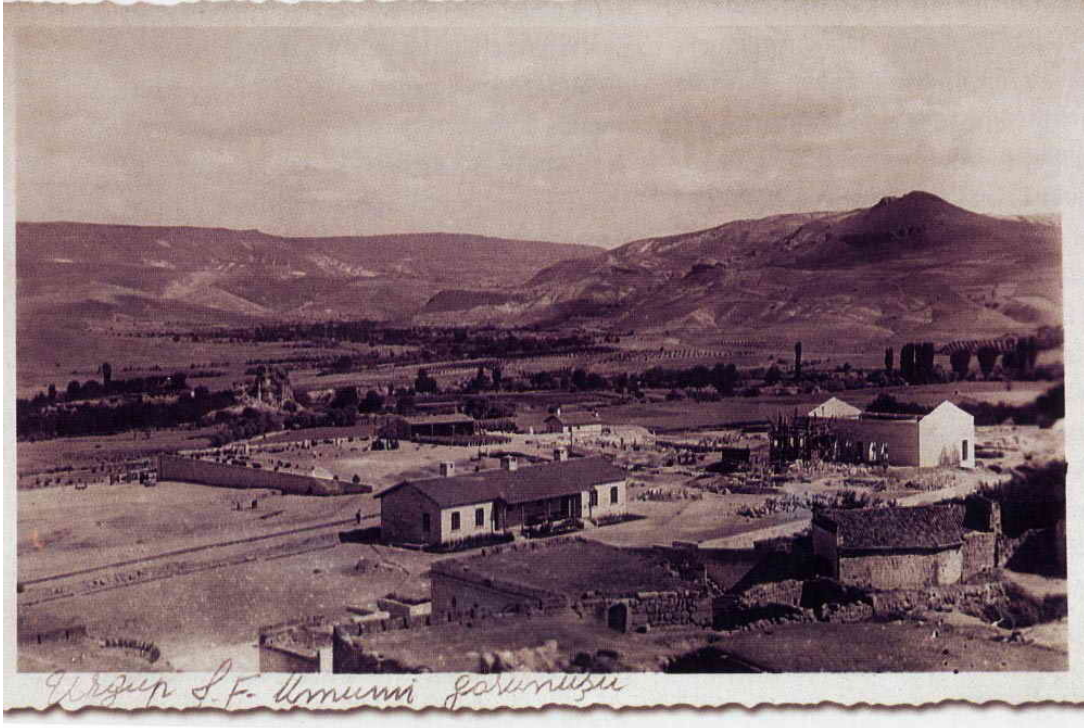
Şarap Fabrikası, 1944